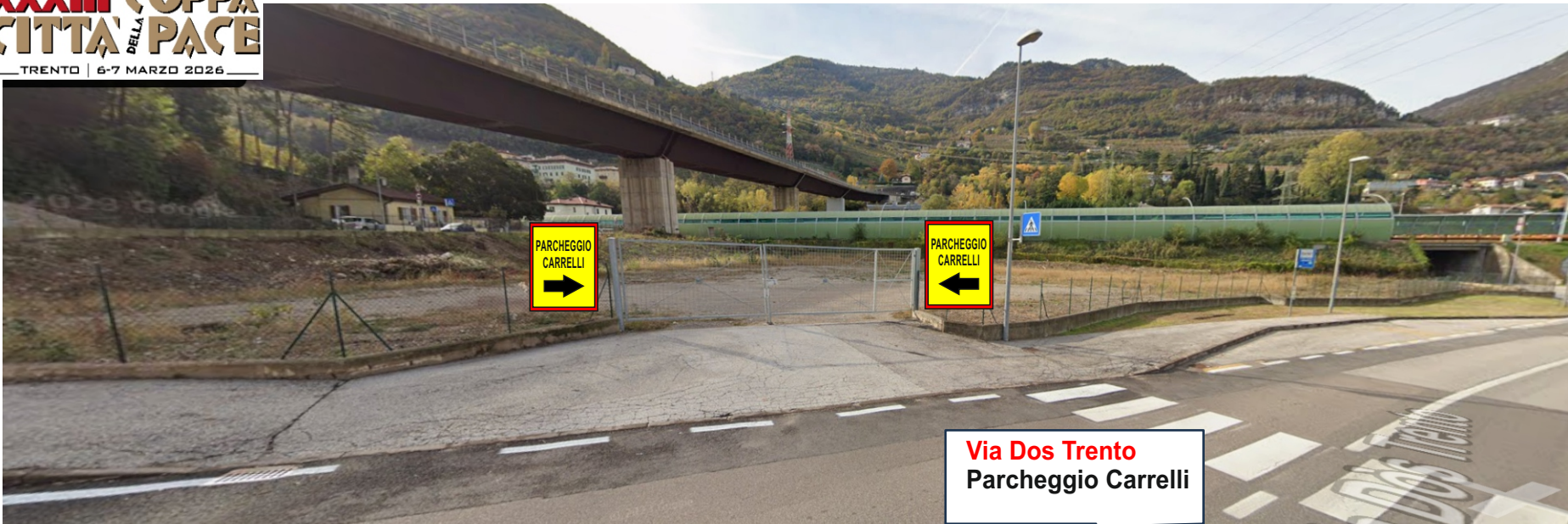
Via Dos Trento Parcheggio Carrelli